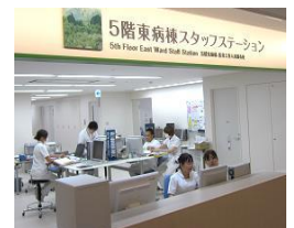
新病棟スタッフステーション